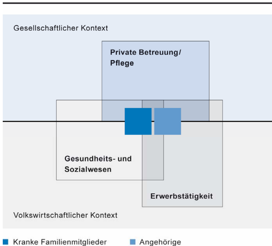
Grafik 1: Einflussfaktoren Betreuung und Pflege von Angehörigen

Angehörige haben aufgrund veränderter Lebensformen und Arbeitsbedingungen heute oft weniger Möglichkeiten, sich in der Betreuung und Pflege von kranken und pflegebedürftigen Familienmitgliedern zu engagieren. Zukünftige Lösungen zum Erhalt der privat geleisteten Betreuung und Pflege von erkrankten Familienangehörigen müssen deshalb den gesellschaftlichen und volkswirtschaftlichen Kontext berücksichtigen. Die nachfolgende Grafik zeigt, welche Faktoren die Situation von kranken und pflegebedürftigen Familienmitgliedern und von betreuenden und pflegenden Angehörigen beeinflussen.