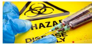
Contrôle des déchets hospitaliers