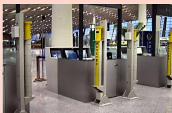
Contrôle Radiologique des Piétons