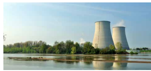
Contrôle d'accès aux installations nucléaires