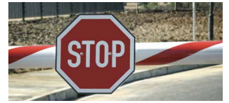
Contrôle aux frontières