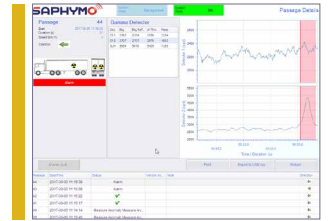
Logiciel de supervision

Cette solution totalement automatique et autonome s'appuie sur un logiciel intuitif et une interface graphique ergonomique.