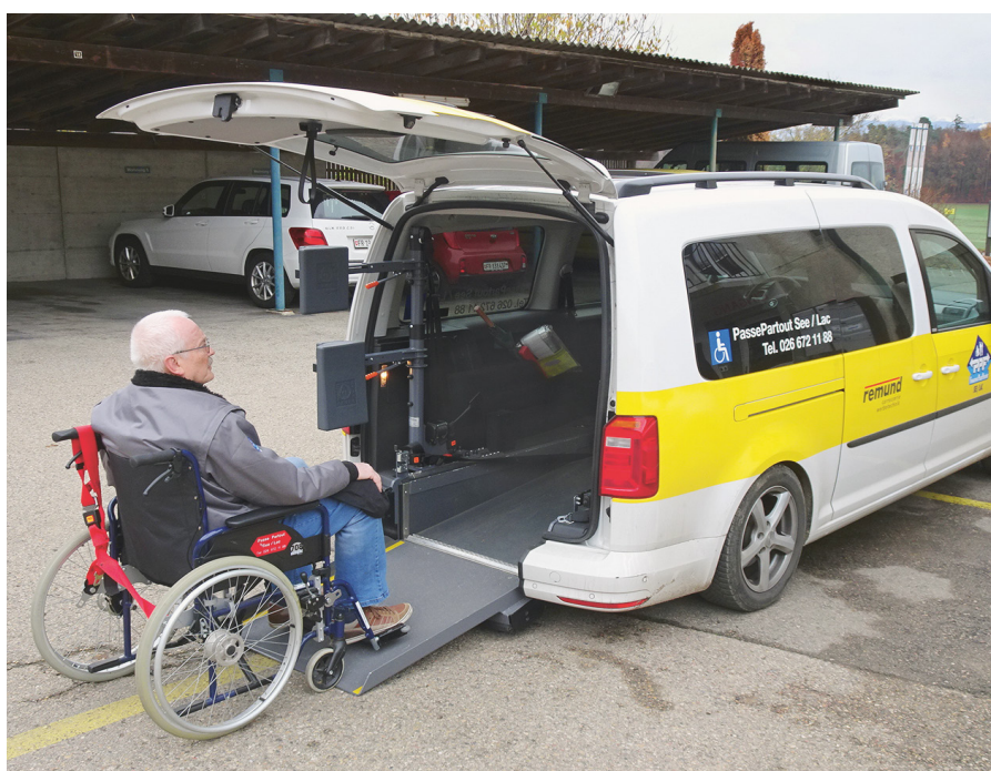
Service de transport bénévole de la fondation PassePartout dans le canton de Fribourg

Dans le district du Lac, PassePartout propose, par exemple, des déplacements sans restriction de but. Le service doit être réservé au plus tard un jour en avance. La centrale de réservation est gérée par le secrétariat de l'EMS Jeuss et financée par le Réseau santé du Lac. Pendant la semaine, les deux véhicules sont toujours utilisés, contre un seul pendant le week-end, car la demande est plus faible.