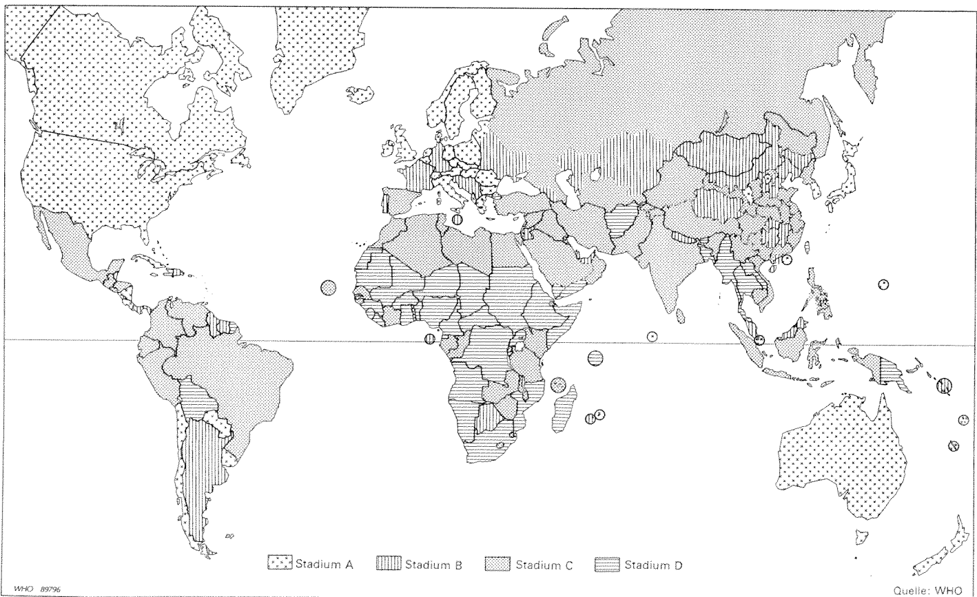
Figure 1: Situation mondiale de la poliomyélite (Etapes en vue de l'éradication, juillet 1989)

Sur la base des déclarations comparées avec des études spécifiques, l'OMS estime à 200 000 – 250 000 le nombre