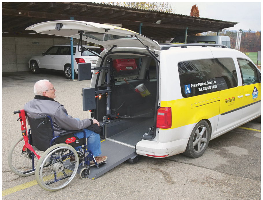
Freiwilliger Fahrdienst der Stiftung PassePartout im Kanton Freiburg

PassePartout Seebezirk zum Beispiel bietet Fahrten zu allen Zwecken an. Eine Fahrt muss spätestens einen Tag im Voraus reserviert werden. Die Reservationszentrale wird vom Sekretariat des Pflegeheims Jeuss betrieben und vom Gesundheitsnetz Seebezirk finanziert. Unter der Woche sind immer zwei Autos im Einsatz, am Wochenende nur eines, da die Nachfrage kleiner ist.