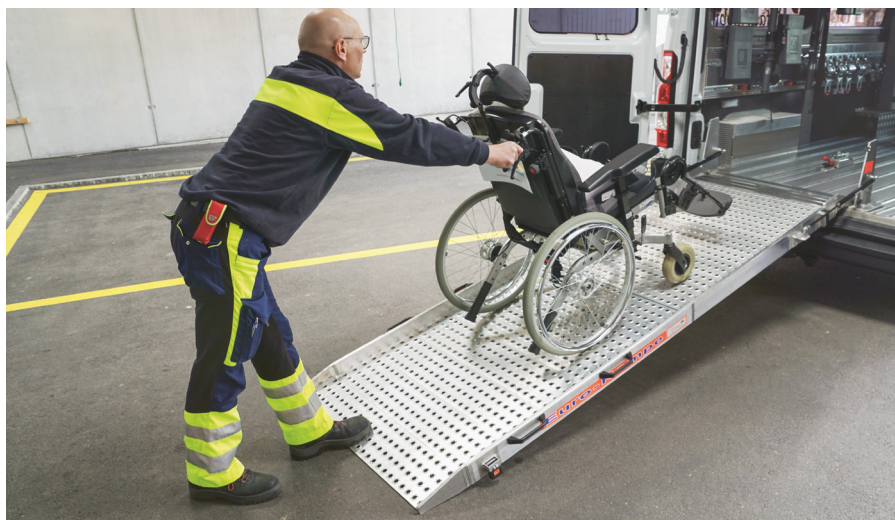
Allround-Fahrdienst easycab im Kanton Bern