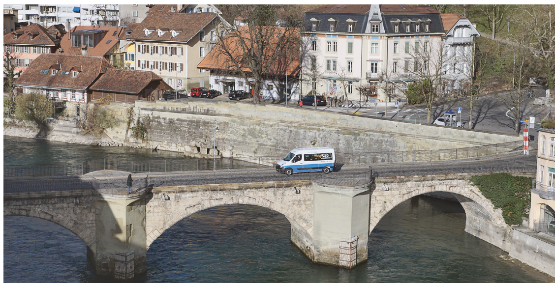
Allround-Fahrdienst easycab im Kanton Bern

Diverse Angebote – hauptsächlich im privaten, aber auch im öffentlichen Verkehr – verhelfen mobilitätseingeschränkten Personen zu mehr Unabhängigkeit und entlasten gleichzeitig die Angehörigen.