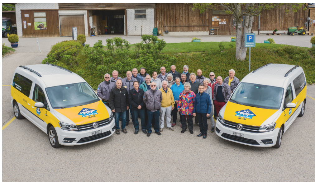
Team See/Lac des freiwilligen Fahrdiensts der Stiftung PassePartout im Kanton Freiburg

Wie die Angebote im privaten und öffentlichen Verkehr konkret ausgestaltet sind und genutzt werden, wird nachfolgend anhand von drei Beispielen, die sich stark voneinander unterscheiden, aufgezeigt. Weitere Angebote werden in Kurzform vorgestellt (siehe Info-Box).