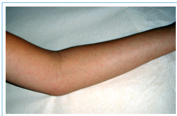
Abbildung 4 Hautausschlag bei Chikungunya-Fieber.

werden. Frühestens 5–7 Tagen nach Fieberbeginn können Antikörper (IgM) nachgewiesen werden.