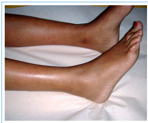
Abbildung 3 Gelenkschwellung des rechten Fusses bei Chikungunya-Fieber.

Während der fieberhaften Phase besteht eine Virämie, und das Dengue-Virus kann mittels PCR nachgewiesen