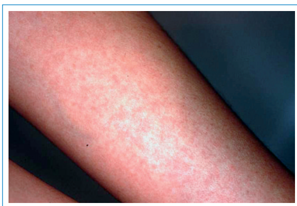
Abbildung 2 Morbilliformer Hautausschlag bei Dengue-Fieber.

sehen Touristen erschreckt auf den ersten Blick. Sie könnte aber durch Kreuzreaktionen mit anderen Flaviviren und durch Impfungen gegen Gelbfieber, Japanische Enzephalitis oder Frühsummer-Meningoenzephalitis verursacht sein oder auf frühere, zum Teil asymptomatisch oder oligosymptomatisch verlaufende Infektionen zurückzuführen sein.